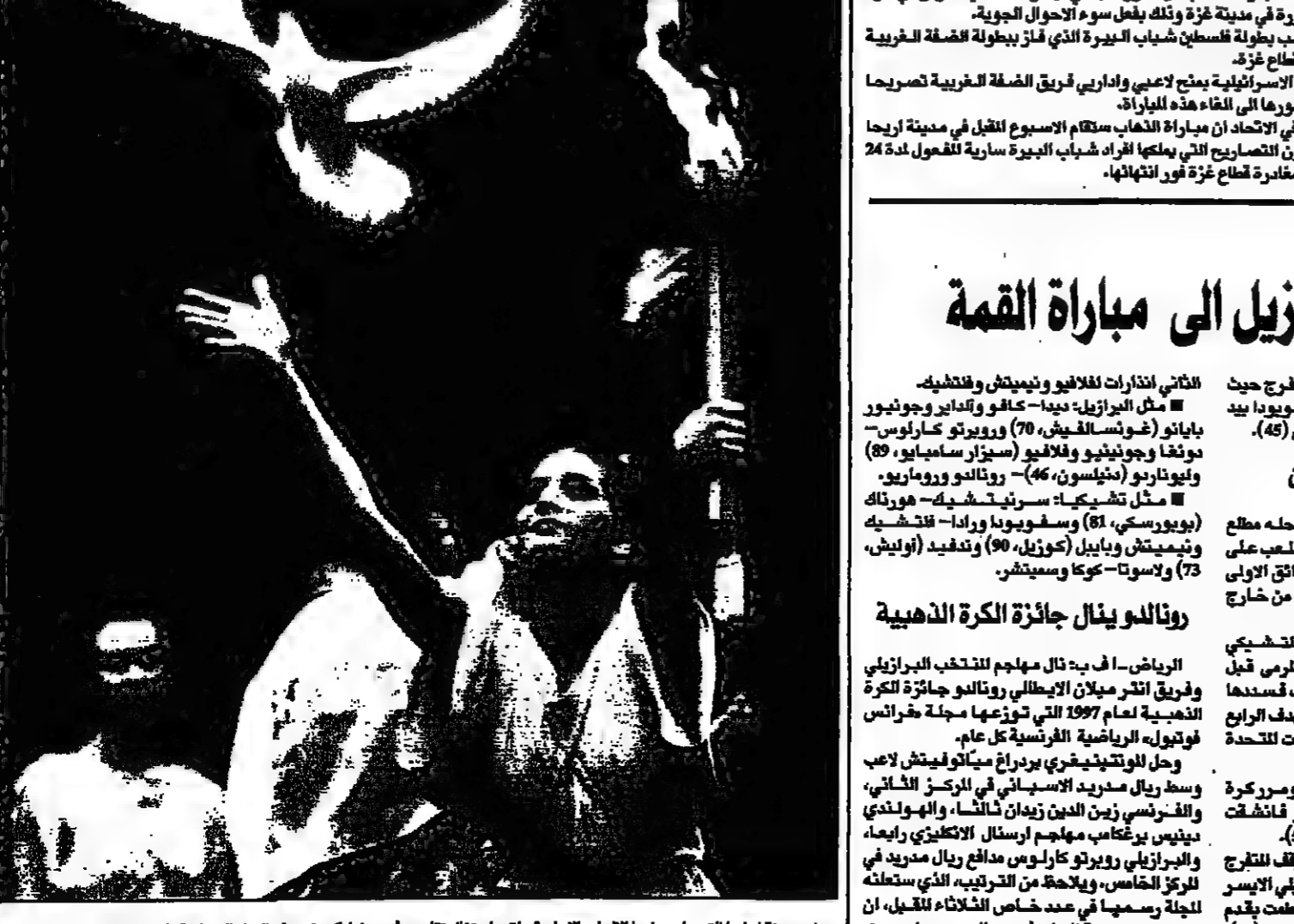
في مدينة اوباما التي ردت فيها الاعجاب الاولية. اتب احتفال تقديري أسس شركته في هذه الفترة اليونانية بالانحاص خلف الحلة

ويبدو ان ادارة فلانسيا للصحافة لرغبة لتدريب الطيب الاستثناء عن العقاق البرازيلي الصغير الذي يكلف النادي 10 الاف دولار يوميا.